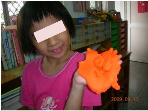
98.09.07 粘土創作表情仍僅有空洞的眼睛